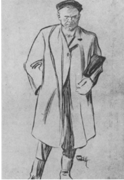
«Kjempen» Jumbo slik han er fremstilt i Braatens artikkel i St. Hallvard. (St. Hallvard 1938, bind 16. Ukjent tegner.)

– Han er ikke mer oberst han, end baken min! sier Matilde. Han sel- ler viser, gjør'n. Men han ser fin ut! Mye finere end far til Spaniolen. 11