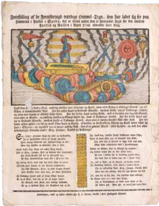
Kistebrev trykt 1768–1770, med visualisering av dommedagstegn.

fra de fortolkende humanvitenskapene over i matematikkens område. Det betyr imidlertid ikke at skillingsvisene oppga jærtegnfortolkningene, eller at nye vitenskapelige forklaringsmodeller gjenspeilet seg der.