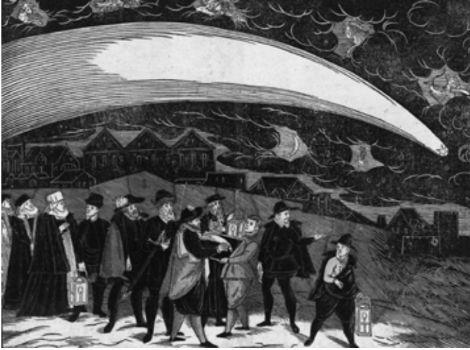
Kometen av 1577, med sin voldsomme og karakteristiske hale, vakte oppmerksomhet over hele Europa. Tresnittet viser kometen over Praha, og ble blant annet brukt i et trykk med en interessant dobbelthet av frykt og fascinasjon i tittelen: «Von einem shrecklichen und wunderbarlichen Cometen». 26.

plassering ikke kunne forandre seg. 24 Bare fem år senere viste en usedvanlig stor komet seg på himmelen. Biskop og humanist Jens Nilssøn (1538–1600) oppdaget kometen over Oslo 10. november. Som Brahes venn var Nilssøn godt informert om astrologiske begivenheter – samtidig som han var på vakt mot alle avvik fra Luthers lære. I 1577 publiserte han et av de tidligst kjente diktene om kometer i Skandinavia, De portentoso cometa , ( Om den illevarslende kometen... ), hvor han, etter grundig gjennomgang av kometens astrologiske bevegelser og betydning var klar i sin konklusjon: den varslet «uten tvil en krenket guddoms vrede, og den er et tegn på veldige ulykker og vonde tap (...) For det er helt klart at det aldri har blusset opp kometer / og brennende fakler på himmelen uten at de har ført ulykker med seg». 25