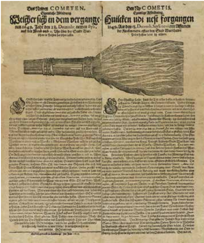
Et flyveblad fra 1650 med kometnytt på tysk og dansk. Kometen, illustrert som en kost, forbinder spaltene (Hentet fra databasen Early European Books/Proquest).