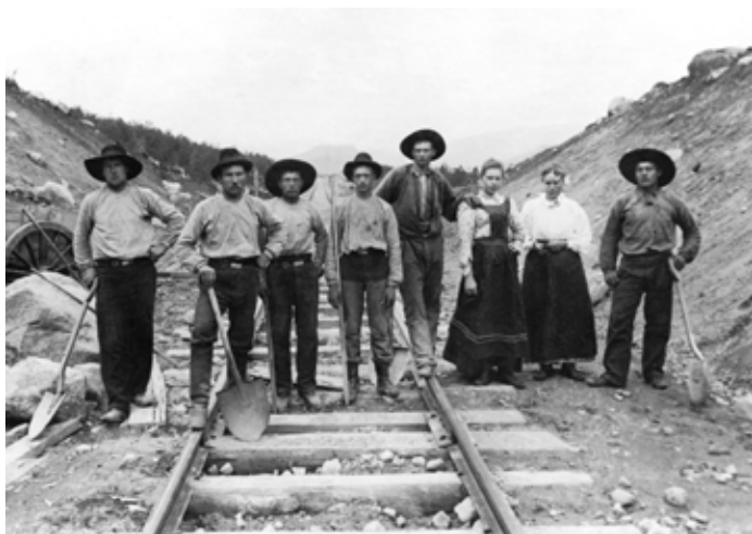
Et arbeidslag ved Malmbanen, år 1900.