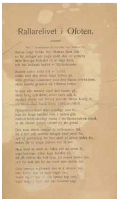
Narviktrykkets første side (Nasjonalbiblioteket).

Som nevnt ovenfor er det mye ortografisk variasjon i teksten, og det er gjort ortografiske valg som får leseren til å lure på om man leser en dansk-norsk eller en svensk tekst. Vi finner både variasjon mellom ulike stavinger av samme ord og variasjon mellom bruk av dansk-norsk og svensk stavemåte gjennom hele teksten. Vi skal nå se nærmere på den ortografiske variasjonen og de ortografiske valgene som er gjort i de fem første versene av teksten. Disse versene er valgt ut som ei avgrensning, og siden resten av teksten er svært lik, vil ikke en i grensen gjennomgang av alle de 31 versene gi noe mer informasjon.